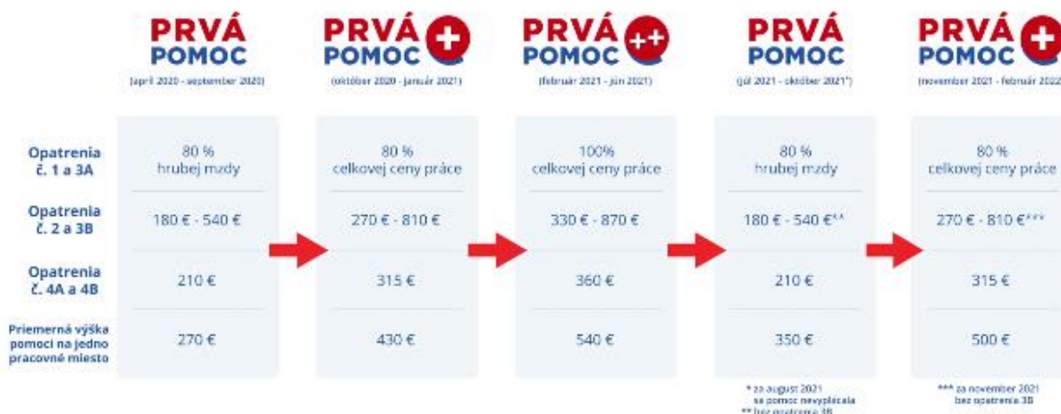
Obrázok 2 Schéma projektu Prvá pomoc

Peniaze boli určené všetkým zamestnávateľom, ktorí museli svoje prevádzky zatvoriť, zamestnancom, ale aj samostatne zárobkovo činným osobám. Bez poskytnutia tejto pomoci by veľa zamestnancov malých a stredných podnikov stratilo svoje zamestnanie. Celý proces poskytnutia pomoci je znázornený na nasledujúcej schéme obrázku číslo 2.